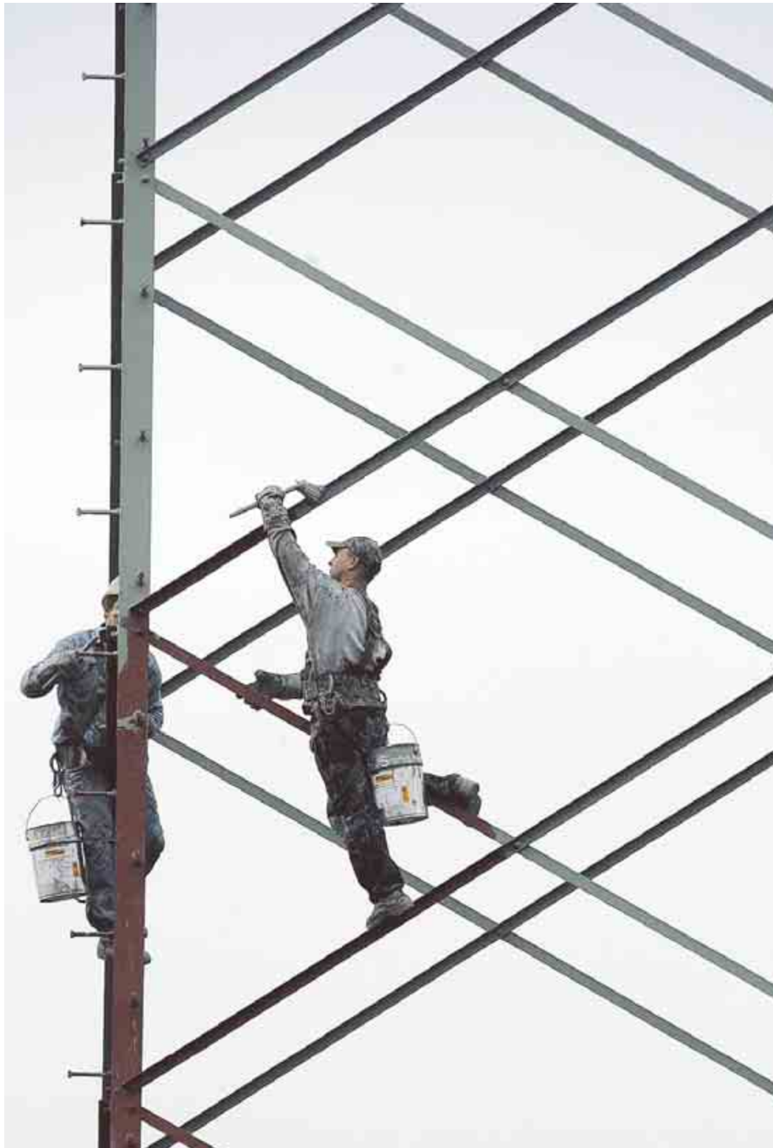
Viele motivierte Polen arbeiten längst in Deutschland – wie hier in luftiger Höhe.

Das frühere Bergbau-Zentrum Gleiwitz ist dafür ein gutes Beispiel. Rund um den polnischen